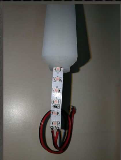
Seleccionar e insertar el led strip en FLEXO

FLEXIT permite alojar tiras con un ancho máximo de 10 mm . Los diseñadores pueden mezclar estos componentes para crear fácilmente looks personalizados. La tira LED puede ser elegida entre cualquier color , crear efectos con RGB o PIXEL LED . El sistema de alojamiento para la tira led permite además conectar varias tiras con distintas alimentaciones. Creando así líneas de luz de gran distancia.