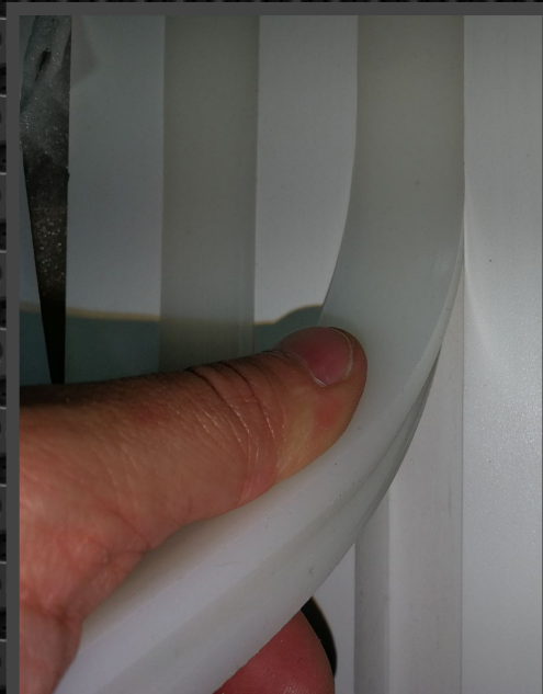
Colocar FLEXIT en su alojamiento